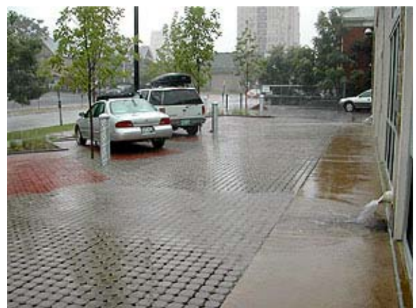
Pavement permeable aumenta la cantidad de tierra de minerals disponible en un sitio muy desarrollada