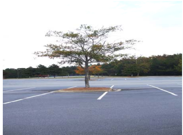
La falta de área superficial libre causa este árbol no crecer a una altura normal.