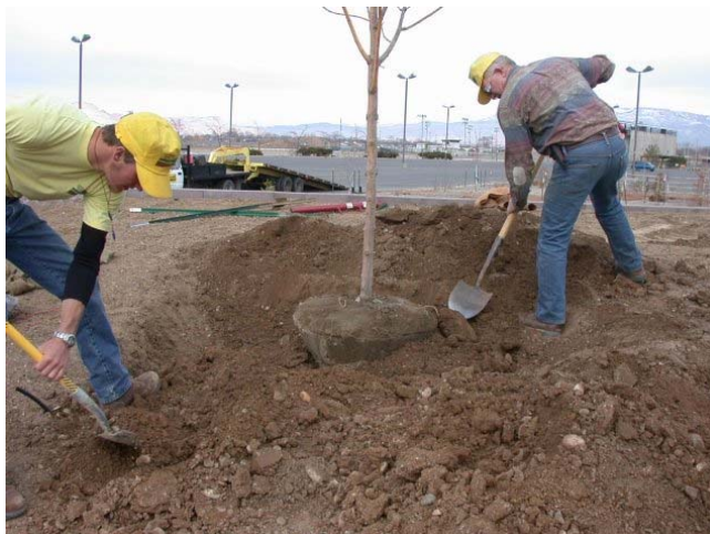
La temporada mejor para plantar arboles es durante la temporada dormida entre noviembre y febrero.