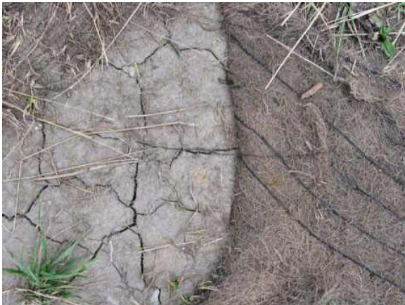
Tierra bien compactada que nunca va a sorportar raises suficiente para mantener arboles saludables.