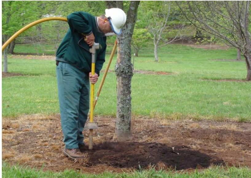
Fig. 5 Aflogar el terreno compactado con un sistema de aire es especialmente efectivo para reducir la compactación superficial. Esta técnica puede dejar muchas raíces finas intactas.