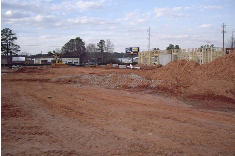
Fig. 3 El movimiento de equipo pesado sobre el terreno durante construcción puede compactar el terreno profundamente. Este tipo de compactación debe ser corregida antes de plantar o los arboles tendran mayor tendencia a desarrollarraices superficiales y ser mas suceptibles a estres humedad.