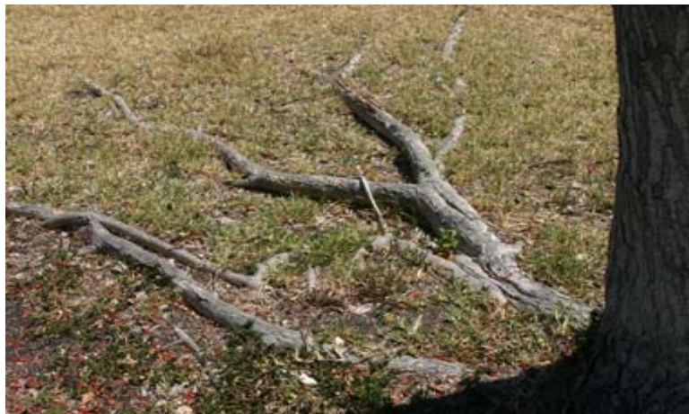
Fig. 4 Los arboles que crecen en terrenos compactados fallan en desarrollar raices fuertes y profundas y raices laterales puede aparecer en la superficie.

Compactación en la superficie del terreno asociada con el tráfico peatonal presenta un diferente set de desafíos para las raíces de los arboles. Típicamente, la mayoría de las raíces finas "alimentadores" de los arboles o corren en la superficie donde materia orgánica, la disponibilidad de nutriente agua y transferencia de oxígeno es mas alta. Cuando la superficie del terreno está compactada, la densidad de las raíces en esta superficie activa se disminuye. El resultado es un arbole con acceso limitado a nutrientes de la tierra. Es más facil corregir compactación superficial que profunda. Sangeado radical y cubrir con pajote pueden mejorar la cualidad de raíz. Aerear el terreno usando una línea de aire de alta velocidad puede aflojar la tierra compactada sin destruir la raíz fina (Fig. 5).